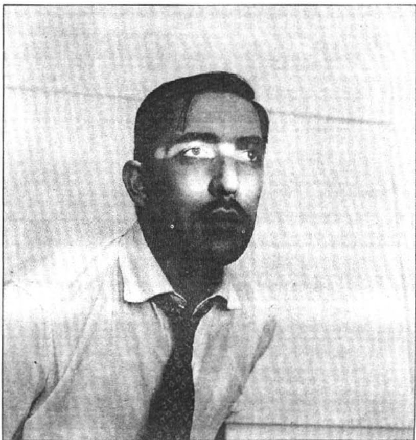
Autoportrait (1950). photos Geraldo de Barros