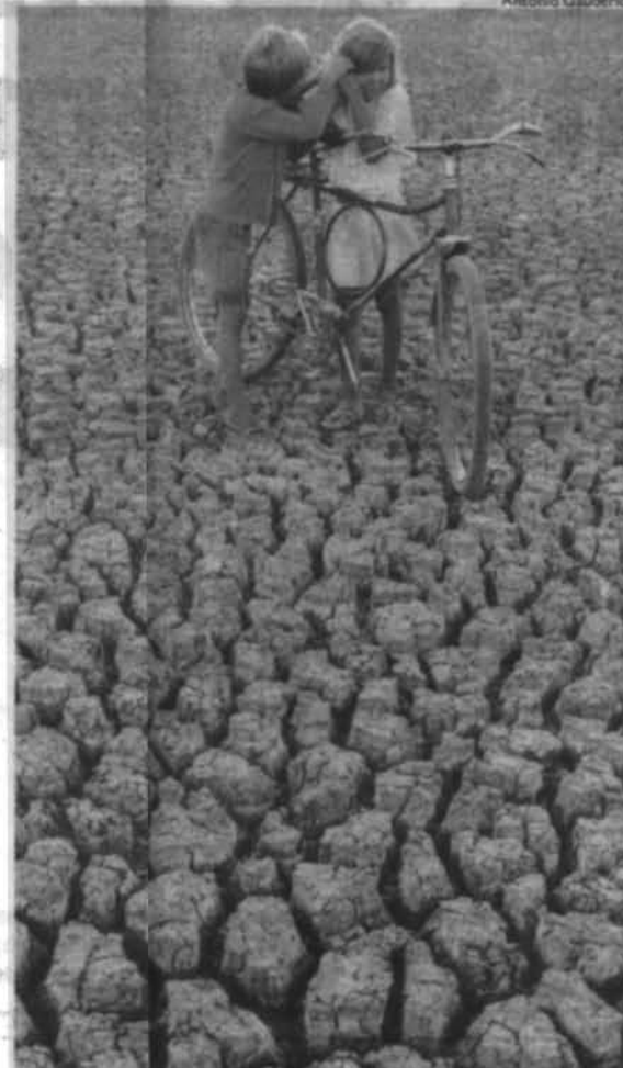
A seca no trabalho de Antonio Gaudério