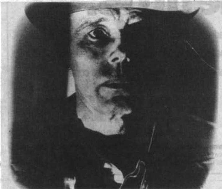
O artista plástico alemão Joseph Beuys, por Keiichi Tahara