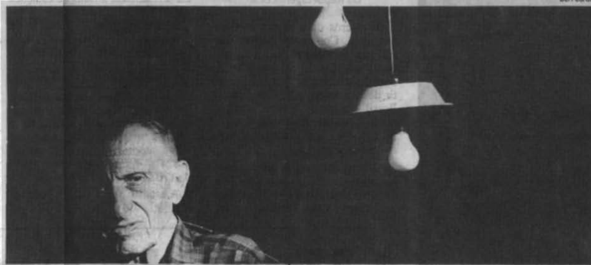
"Lívio Abramo", trabalho realizado em 1991 que fará parte de uma das exposições