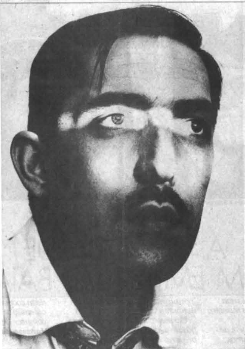
Auto-retrato de Geraldo de Barros, de 1949: pioneirismo.

NA MOSTRA "FOTOFORMAS", NO MIS, COM FOTOS QUE GERALDO DE BARROS PRODUZIU ENTRE 1946 E 1951.