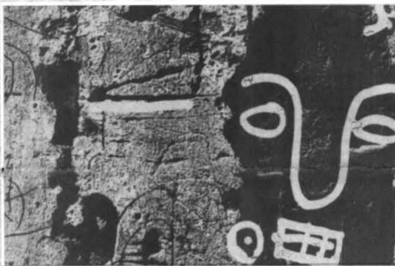
As explorações fotográficas de Barros serviram de base para seu ingresso na arte concreta. Aquil, ponta seca em nanquim sobre negativo.

Conhecer nos anos 90 os experimentos fotográficos feitos por Barros na década de 40 é uma experiência no mínimo reveladora. A fotografia com intenções plásticas é considerada uma linguagem atual. O trabalho vanguardista da