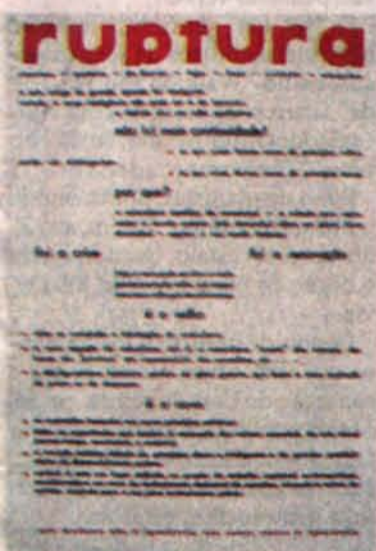
Acima, reprodução da capa do Manifesto Ruptura, lançado em 1952